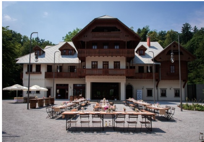
Švicarija